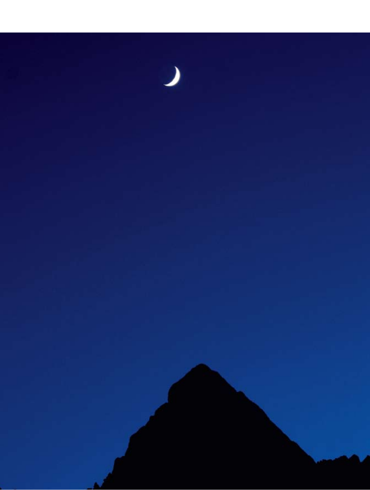
Špik in luna