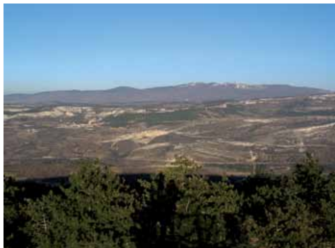
Kraški rob in Slavnik z Lačne

Zahtevnost: Nezahtevna označena pot, zahteven je le krajši odsek pri spodmoli, kjer moramo s pomočjo skob in jeklenic preplezati skalni prag.