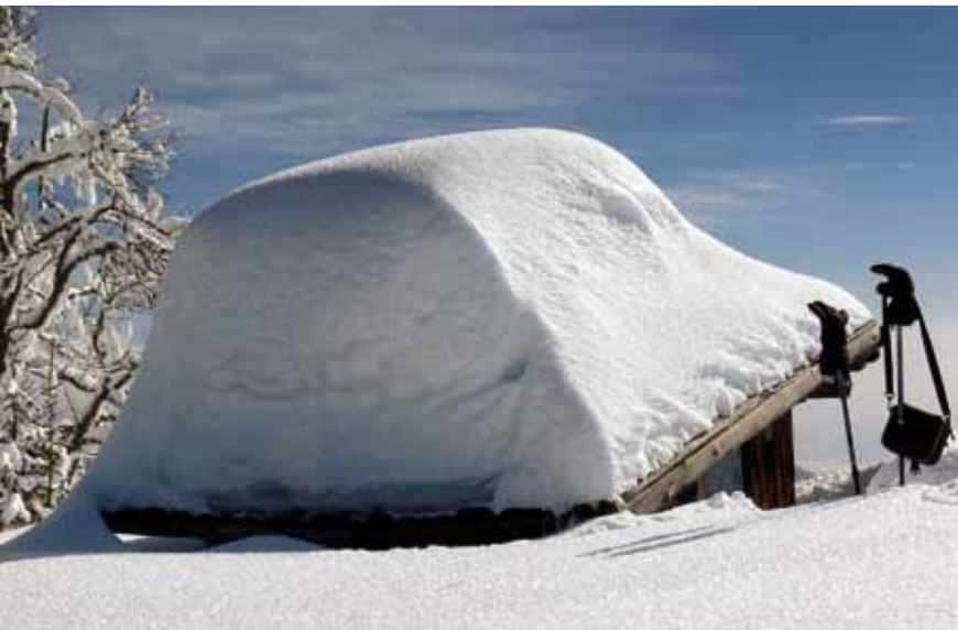
Bivak na Jerebikovcu