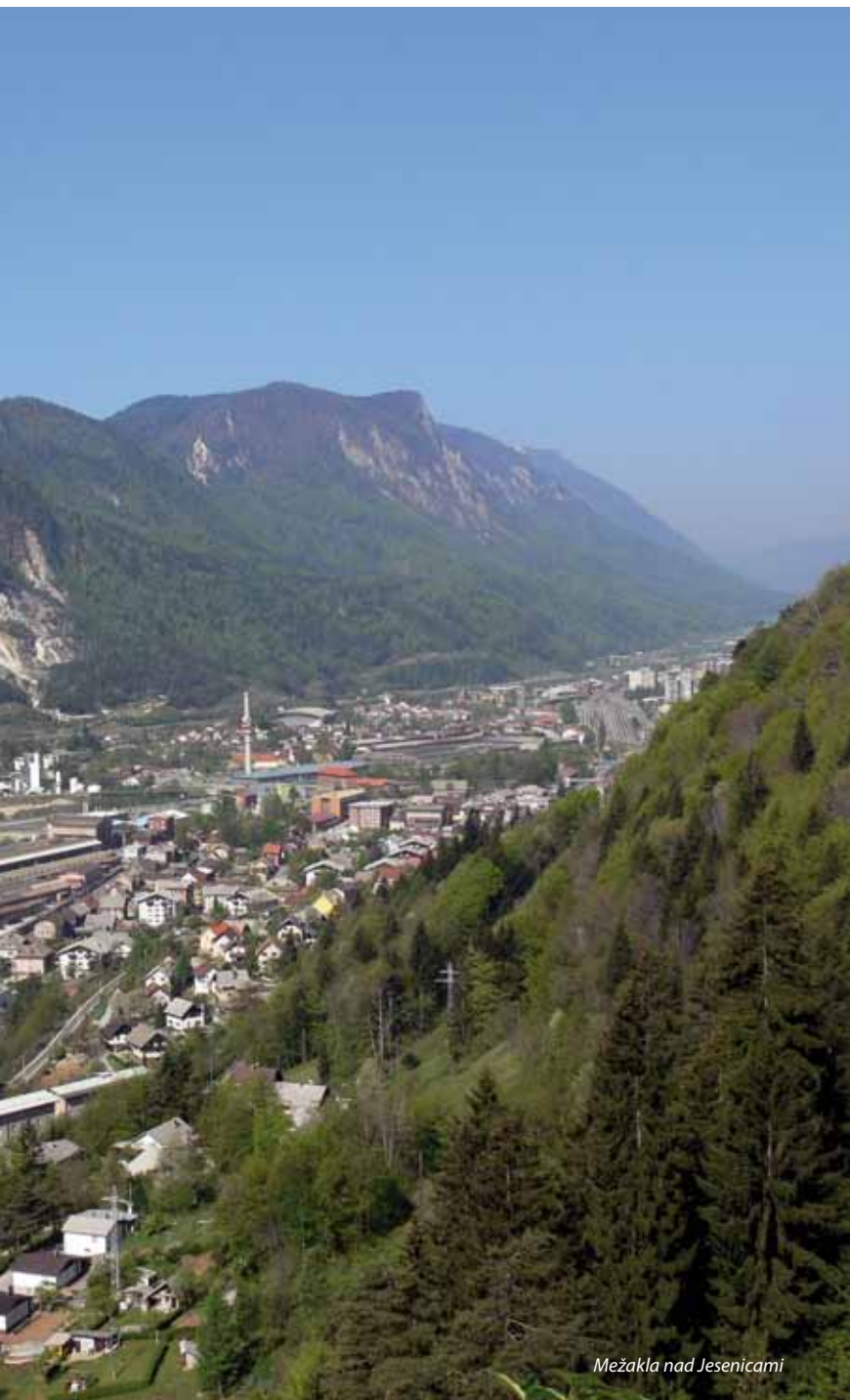
Mežakla nad Jesenicami