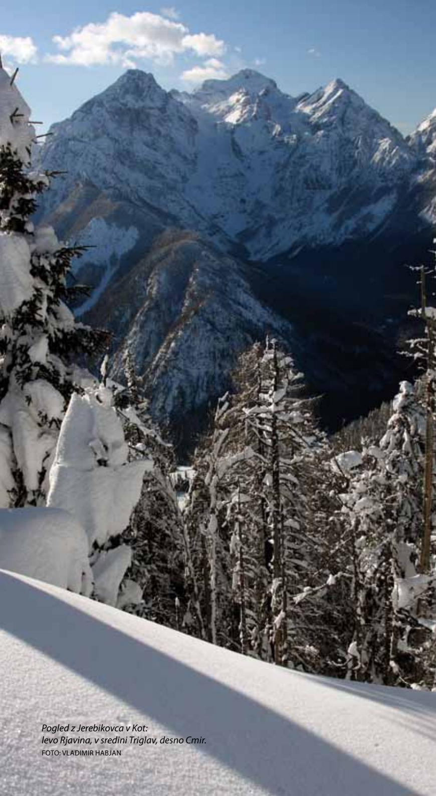
Pogled z Jerebikovca v Kot: levo Rjavina, v sredini Triglav, desno Cmir.