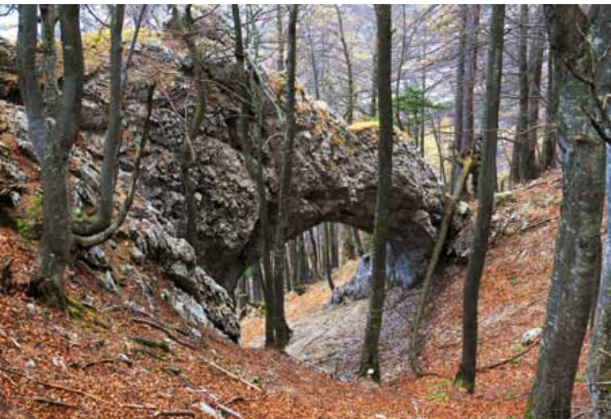
Naravni most na Planskem vrhu