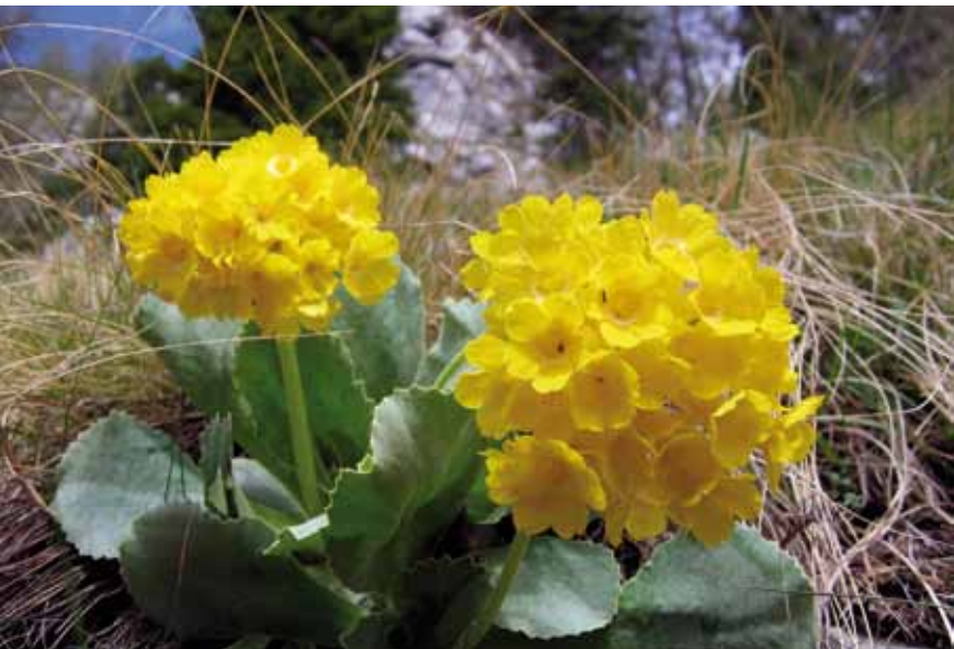
Avrikelj v Zadnji dolini