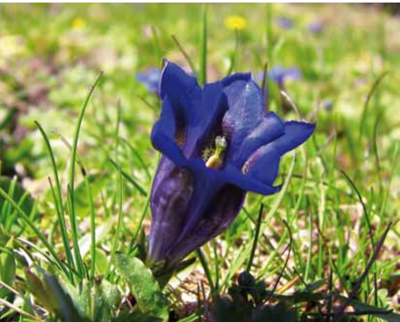
Encijan v Zgornji Radovni