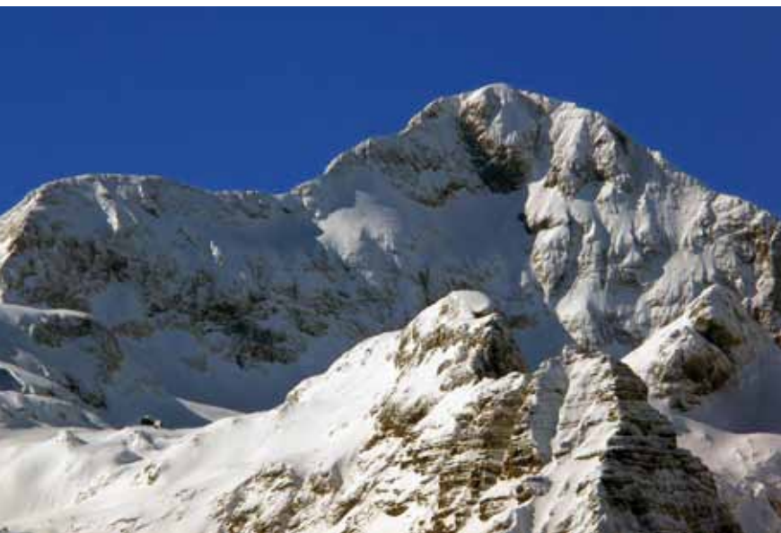
Pogled z Jerebikovca na Triglav