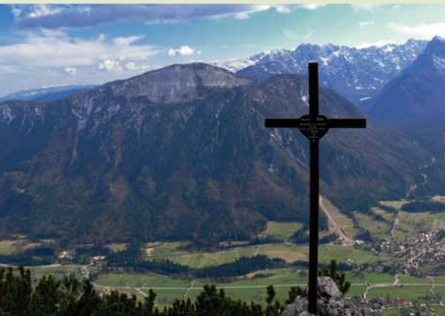
Jerebikovec z Borovelj

Zemljevidov je več, saj si Mežaklo lastijo kar tri občine: Jesenice, Kranjska Gora in Gorje in vsaka ima svojo karto. Priporočam turistični zemljevid občine Kranjska Gora (1 : 30.000) in turistično karto občine Jesenice (1 : 25.000).