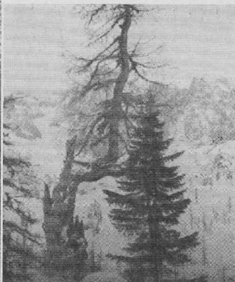
Viharnik na Stiemenu v višini ca. 1850 m

čeno ime! Pojdi pod taka drevesa, ko tuli črez robove vihar. Ob vsaki veji in vejici, ob vsakem odlomljenem koncu, ki se trdovratno še drži debela, žvižga veter svoje posebne gorske melodije. Posebno lepi pa postanejo ti viharniki, ko jih zimski viharji od vseh strani ometejo z ledenimi kristali in se nato na najmanjše vejice obesijo še bleščeči kristali ivja! Iz vsakega težko ranjenega, oklešččenega, od vetrov razmršenega junaka se v sončni luči užigajo bleščeče iskre.