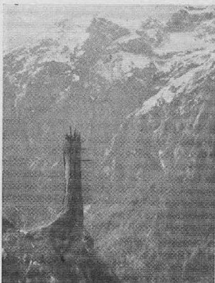
Ponosni ostanek junaka pod Brano