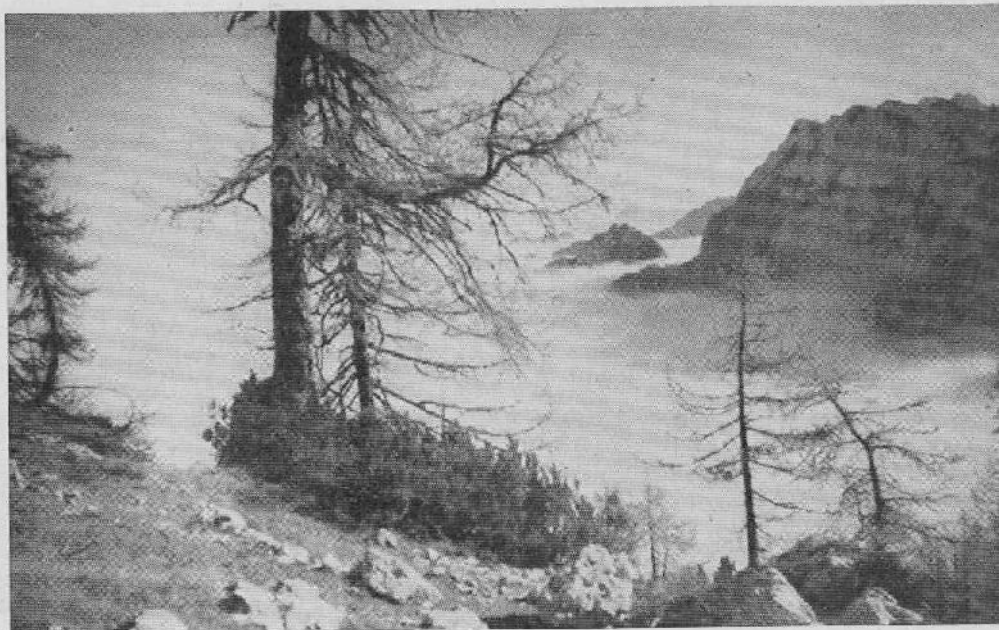
Gozdna meja nad Rupami v jeseni