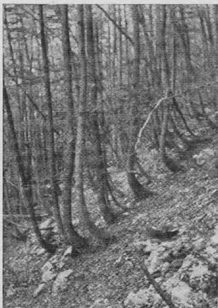
Ukrivljene bukve na drsnih tleh pod Stenarjem