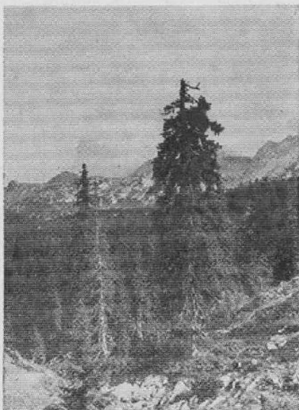
Težko življenje na kraških tleh Komna