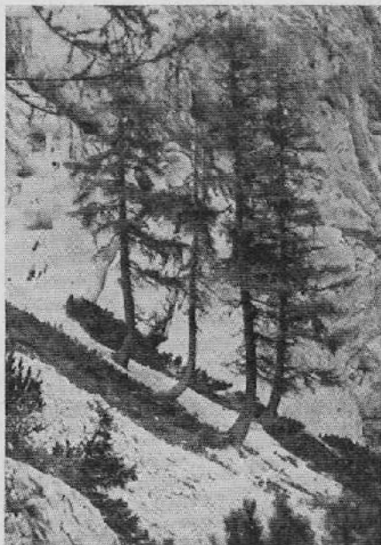
Macesni na drsečih tleh. Pod Oltarji

vleče proti dnu doline. Premik, ki mu pravimo drsenje tal, je sicer izredno počasen in tudi zelo različen. Toda drevesa se mu morajo prilagoditi, drugega izhoda ni. Človek pa opazi to počasno premikanje na drevju samem, kajti vsa debela so na takem počasi drsečem svetu (Nemci mu pravijo »das Gekrieche«) pri koreninah ukrivljena. Začetkoma je deblo bolj ali manj nagnjeno v smeri doline, kamor težijo kamnita tla. Včasih so pri tleh skoraj vodoravna, bolj redko celo za več kakor devetdeset stopinj od navpičnice upognjena!