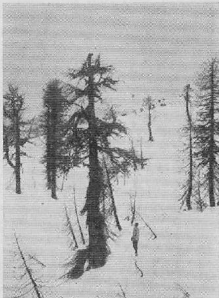
Viharnik na Vrtaškem vrhu (1900 m)

rastejo iz malone golih kraških tal. Drevesna armada je zdesetkovana, posamezniki so zato tem bolj izpostavljeni sili viharjev, ki jim lomijo vrhove, trgajo veje, krive debela v vreteno in preživle veje se stiskajo k deblu in se ga tesno oklepajo, da nudijo čim manj opore vetrovom.