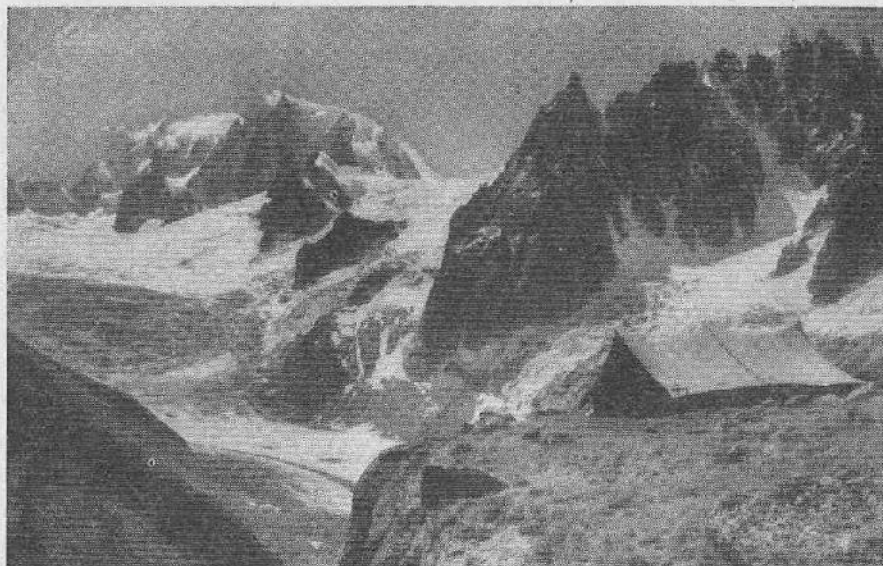
Zgornji plató Glacier du Géant in seraki. V ozadju skupina Mont Blanca, desno skupina Chamoniških igel