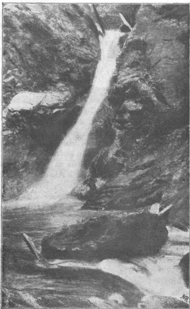
Pohorje: Mali Šumik, slap Lobnice.

Dal sem si skuhati žgancev, in skuhalo so se „žganci.“ Ne rečem,