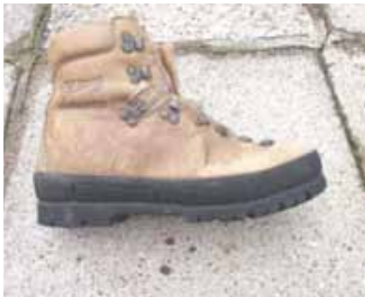
Gumijasti trak na poltogh čevljih, ki so primerni za dereze

obdelanega na čevljarskem kopitu. Izbiramo lahko med spodvito in v banjo gumijastega podplata vloženo lupino. Prednost naj ima spodvita. Njena debelina brez notranje blazinjene plasti naj se giblje med 2,6 in 3,2 mm. Če bomo čevlje rabili vso zimo skoraj vsak konec tedna, je zaželen dobro zlepljen gumijasti trak okoli spodnjega dela, ki na videz povezuje zgornji rob podplata in spodnji del spodvite lupine. Ta bo nekoliko povečal togost čevlja, od katere pa je odvisno, kakšne dereze bomo lahko uporabljali. Na poltoge čevlje gredo poltoge členaste dereze. Te pa so tudi najprimernejše za celodnevne zimske pristope. Z njimi se posredno izognemo predebelemu podplatu ali zelo togi lupini, ki ovirata nekoliko lahkotnejšo hojo, prestopo, sestope in preččenja. Zaradi tega so čevlji še vedno dovolj učinkoviti za mešani svet, kjer se menjavajo skala, sneg, snežni poprh in požled.