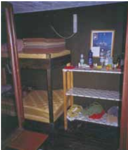
Pozimi je Kranjska koč in s tem njena zimsko soba malo obiskana