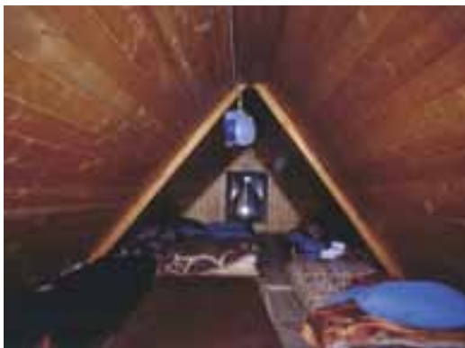
Ležišča v zimski sobi

ženosti čiščenja, vendar je potrebno reči, da je vse skupaj suho, kar pa je nenazadnje najpomembnejše. Sem pa našel v zgornjem prostoru približno dvajset rjuh za enkratno uporabo. In kaj bo, ko bo teh zmanjkalo? No, spalna vreča se tu že obrestuje, saj tako velike zimske sobe oziroma kočice nekaj ljudi s kuho na prenosnih kuhalnikih že ne segreje.