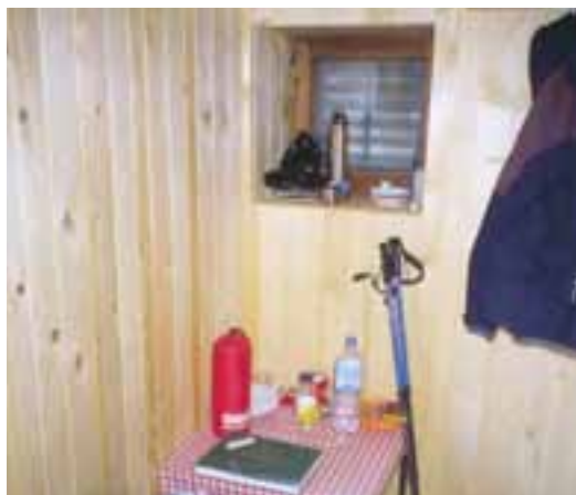
V zimski sobi se je našel prostor tudi za majhno mizico

ke. V primeru, da bi bilo gornikov več, kot se jih lahko stisne v sobi, je v okolici kočice več pastirskih staj (ali bolje rečeno vikendov), kjer se lahko pod streho namesti cela četa ljudi. Toda omenjene staje nudijo le streho in sta tedaj nujno potrebni dobra spalna vreča in izolacijska podloga.