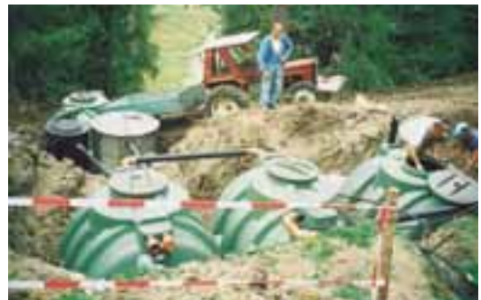
Montaža čistilne naprave